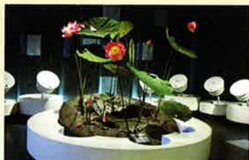
蓮の観察コーナー