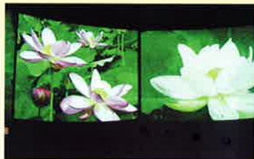
120インチ3画面大スクリーンシアター