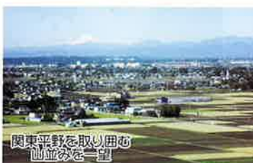
関東平野を取り囲む 山並みを一望 高さ50メートル360度大パノラマ展望室