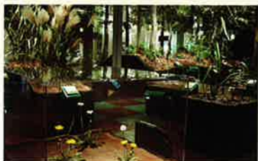
行田の自然 ジオラマ展示室