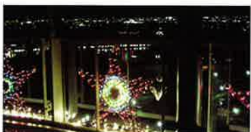
クリスマスイベント「夜景を楽しむ」