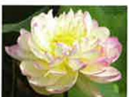
㊴ ミセス・スローカム