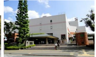
越谷サンシティホール