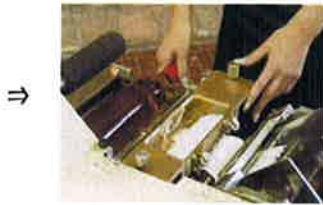
⑤ラベルの裏に機械でのりをつけてしっかりビンに貼ります。