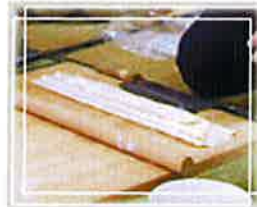
③伸びた生地をたたむ