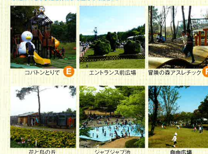
コバトンとりで E エントランス前広場 冒険の森アスレチック F 花と鳥の丘 ジャブジャブ池 自由広場

園内には芝生の広場やアスレチック、ジャブジャブ池などがあります。花や緑に囲まれて、思いっきり手足を伸ばして遊んでください。